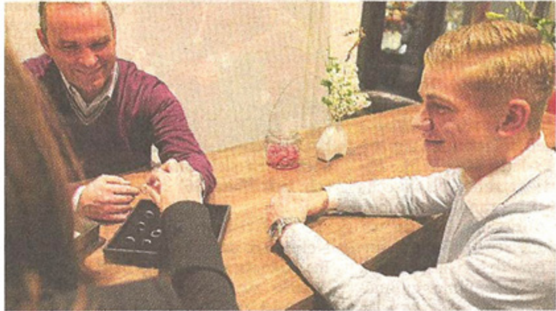
Ausprobieren ist eine der goldenen Regeln bei der Wahl der Trauringe. Bei dem Juwelier „Marrying“ werden Brautpaare kompetent beraten.

► Vielfalt an Materialien: Es gibt Trauringe in Gelb-, Rot-, Rosé- und Weißgold oder Platin. Die Proportionen der Hände und die Hauttöne helfen hier weiter, das ideale Material zu finden. Ausprobieren ist der beste Weg! Und die Braut, die ja meist mehr als nur den Ehering am Finger trägt, sollte in Gedanken auch ih-